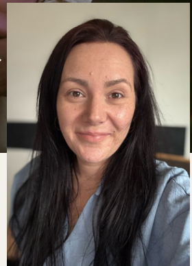
Ich bin für dich da